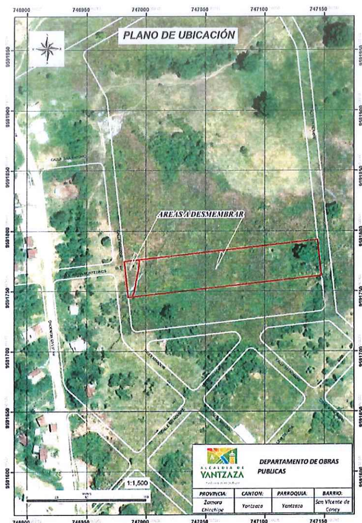
Imagen 1. Ubicación de los terrenos a expropiar.